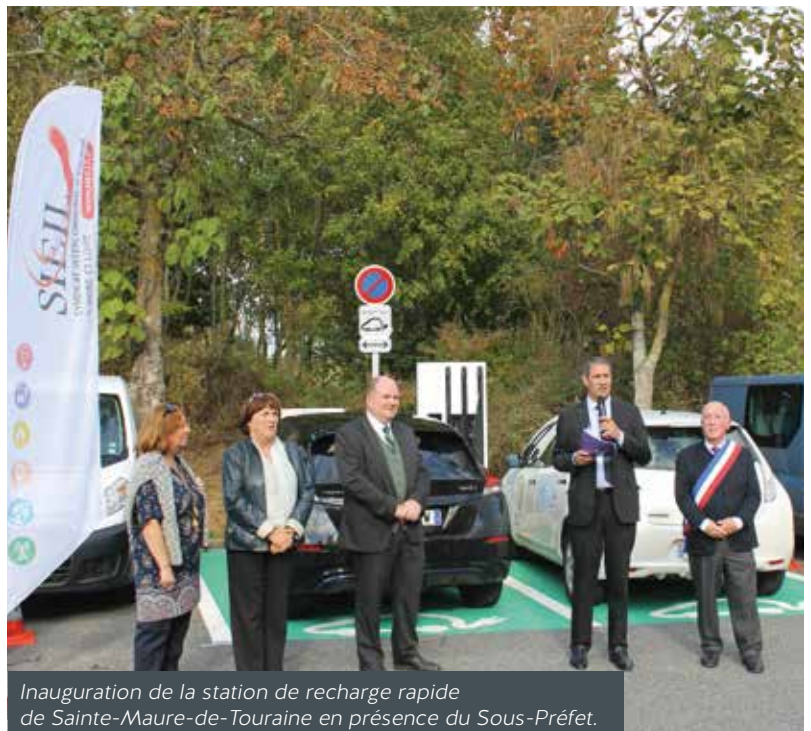
Inauguration de la station de recharge rapide de Sainte-Maure-de-Touraine en présence du Sous-Préfet.

Disque vert : le SIEIL a signé la convention nationale sur la mobilité propre dont l'un des volets concerne l'instauration d'un disque vert européen autorisant le conducteur citoyen à stationner gratuitement sur la voirie en zone payante durant 2 heures ainsi que sur les zones vertes. Les communes souhaitant appliquer ce dispositif peuvent se renseigner auprès des services du SIEIL.