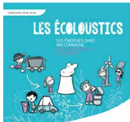
Le concours Ecoloustics est ouvert à toutes les écoles d'Indre-et-Loire

Le concours est organisé en partenariat avec la Direction des Services Départementaux de l'Éducation Nationale Indre-et-Loire et sous le haut patronage du Ministère de l'Éducation nationale. Les élèves ont jusqu'au 21 décembre pour s'inscrire et jusqu'au 12 avril 2019 pour remettre leur dossier au SIEIL.