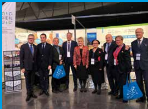
Les élus sur le stand du SIEIL au Congrès des maires 37 le 27 novembre 2018

Les entités Modulo et EneRCentre-Val de Loire étaient également à l'honneur sur le stand du SIEIL. Cet événement leur a permis de se faire connaître plus largement en Indre-et-Loire.