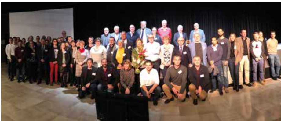
Toute l'équipe du SIEIL vous souhaite une bonne année 2019.