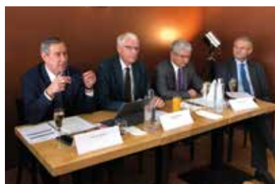
< Conférence de presse Modulo le 11 octobre 2018, en présence du SIEIL et du SIDELC

Téléchargez > la plaquette sur www.sieil37.fr rubrique activités / MODULO