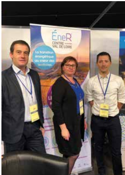
La nouvelle équipe EneRCentre-Val de Loire au Congrès des maires d'Indre-et-Loire le 27 novembre 2018

Télécharger la plaquette sur www.enercvl.fr