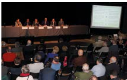
Réunion sur le gaz