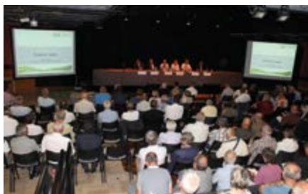
Réunion sur l'éclairage public

Après le succès de la réunion d'information sur l' électricité organisée en octobre 2016 à l'espace Malraux de Joué-lès-Tours, le SIEIL a souhaité décliner le concept aux autres compétences et a donc proposé deux réunions supplémentaires en 2017, l'une sur le PCRS (Plan de Corps de Rue Simplifié) en mars et l'autre sur l' éclairage public en juin. Le 27 mars 2018, le SIEIL a également mis en lumière la compétence gaz , en complétant la réunion par un espace de rencontre avec les fournisseurs. Près de cent cinquante délégués et Maires des communes d'Indre-et-Loire ont assisté à chacune de ces séances.