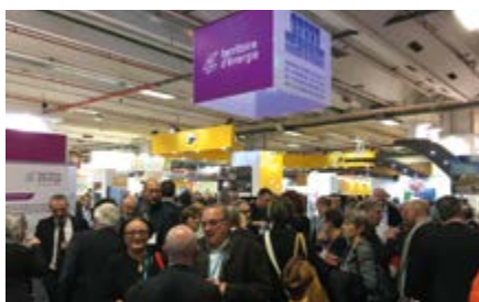
Salon des Maires de Paris le 22 novembre 2017

Chaque année, le SIEIL est présent sur les différents salons des Maires, que ce soit à l'échelon national à Paris ou départemental à Tours . Ces moments-clé favorisent les échanges avec les élus et permettent de présenter l'étendue des compétences du SIEIL.