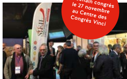
Congrès des Maires de Tours le 30 novembre 2017 au Vinci à Tours

Prochain congrès le 27 novembre au Centre des Congrès Vinci