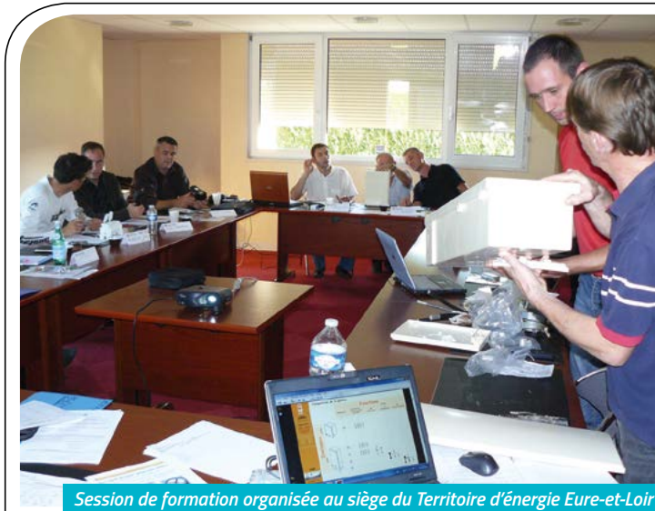
Session de formation organisée au siège du Territoire d'énergie Eure-et-Loir

La formation des élus a aussi été organisée avec la visite de sites, tels que celui de l'ISFME à St Affrique et des formations liées à l'électricité.