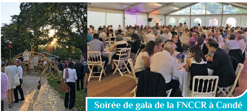
Soirée de gala de la FNCCR à Candé