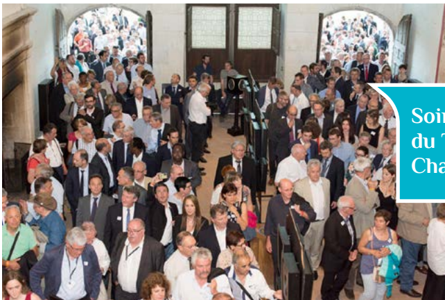
Soirée du TECV à Chambord