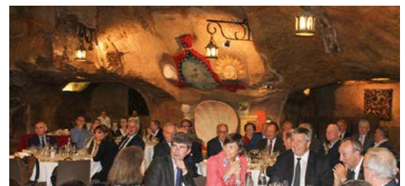
Soirée du Conseil d'administration à Chinon