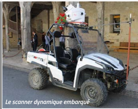
Le scanner dynamique embarqué

Par simple "clic", élus locaux et services accèdent désormais à des données essentielles pour la gestion communale et l'aménagement