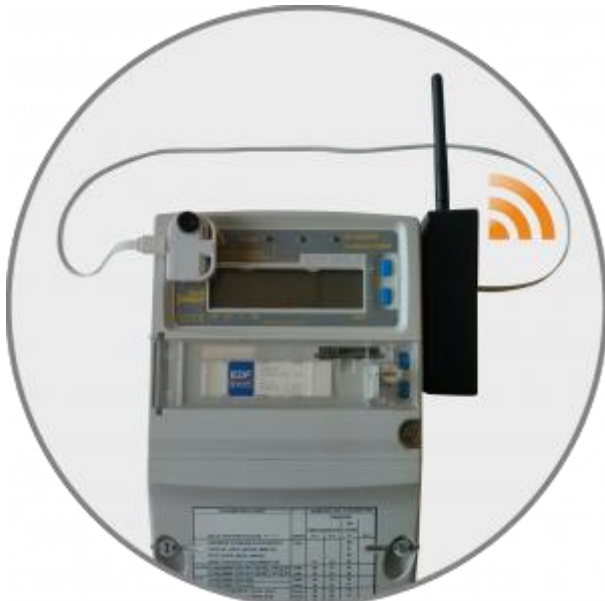
Le capteur Belsenso FM430 de Fludia Fludia

Fludia élargit sa gamme de capteurs Belsenso, notamment avec un dispositif de télérelève des compteurs électriques interfacé au réseau Lora de l'Internet des objets (IOT).