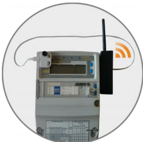
Le capteur Belsenso FM430 de Fludia Fludia

Fludia élargit sa gamme de capteurs Belsenso, notamment avec un dispositif de télérelève des compteurs électriques interfacé au réseau Lora de l'Internet des objets (IOT).