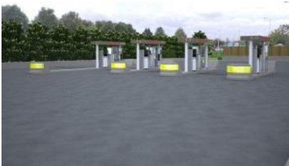
Projet de station GNV et bio-GNV à Bonneuil-sur-Marne (94)

Sur le port de Bonneuil-sur-Marne, dans le Val de Marne, le syndicat d'énergie Sigeif a inauguré ce 24 novembre une station-service de gaz naturel pour véhicules (GNV). Le début d'un plan de déploiement qui pourrait tripler le nombre de stations GNV en Ile-de-France.