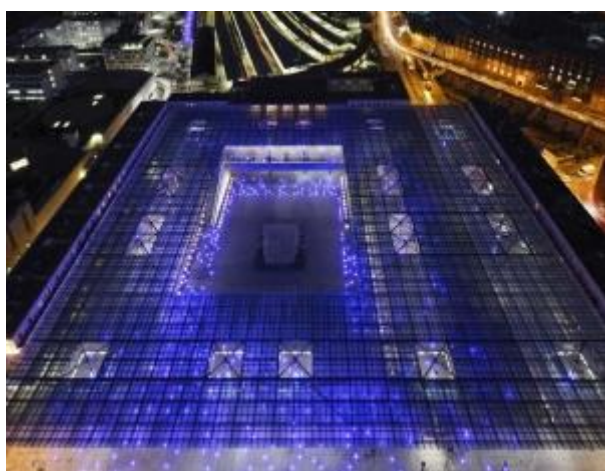
Amiens, place Alphonse Ficquet

Dans le cadre des premiers Trophées de l'éclairage innovant AFE/ID Efficience Territoriale, remis le mardi 13 septembre dernier à Lyon lors des Journées nationales de la lumière de l'Association française de l'éclairage (AFE), trois collectivités ont été distinguées pour leurs pratiques innovantes et exemplaires en matière d'éclairage. Près de 50 maîtres d'ouvrage publics et privés avaient fait acte de candidature, avec des réalisations innovantes allant d'une nouvelle philosophie de l'éclairage en passant par les LED, la fibre optique ou encore le solaire. Dans la catégorie éclairage intérieur : la salle des conférences « Jean Michel » de la CCI du Doubs a été distinguée pour une réalisation d'éclairage dynamique. Dans la catégorie éclairage public, c'est la ville de Lille qui a reçu un prix pour la réalisation d'éclairage visant à redynamiser une rue commerçante (rue Léon Gambetta). Enfin, dans la catégorie mise en valeur du patrimoine, c'est Amiens Métropole qui a gagné avec la mise en lumière dynamique de la place Alphonse Ficquet.