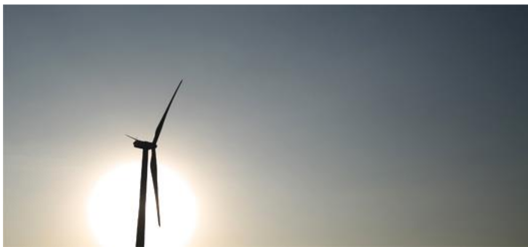
Éolienne du parc de Fenton aux États-Unis

L'Agence internationale de l'énergie (AIE) a publié aujourd'hui son « Medium-Term Market Report 2016 » portant sur les perspectives des énergies renouvelables d'ici à 2021. Elle y revoit notamment à la hausse ses projections de développement de la production d'électricité « renouvelable ».